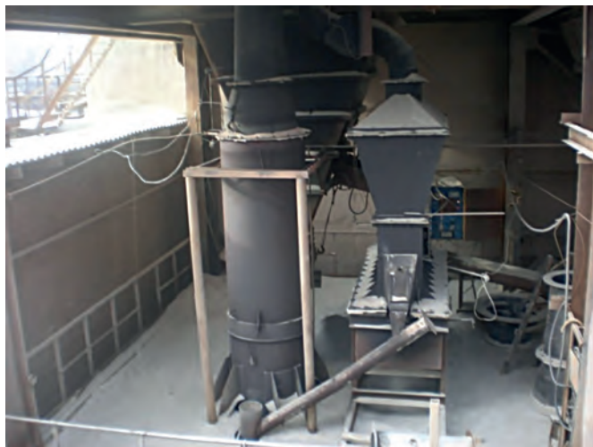
Рис. 1. Піч киплячого шару для попередньої термopідготовки перлітової сировини і шахтна піч для спучування